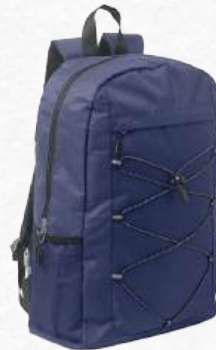
ACC8392 Sac à dos polyester 600D RPET cordon & poche zippée BLEU / MO2491-04