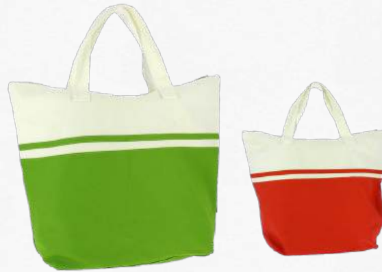
ACC87450 / ACC8749 Sac de plage en coton «Souls 42 x 47 cm