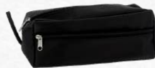
ACC5825 Trousse toilette noire voyage 2 pochettes