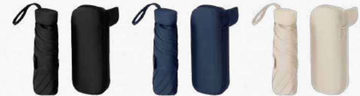
ACC8773 Parapluie pliable de 90 cm de diamètre en polyester 190T à 6 panneaux