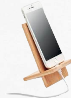
M09944-40 Support téléphone bambou