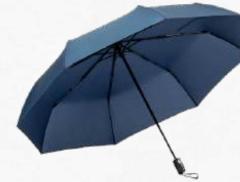
ACC8904 Parapluie pliable de 120 cm ouverture et fermeture automatiques