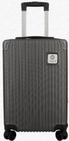
EMB6550 Valise cabine Dublin 50 x 32 x 23 cm