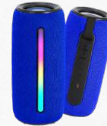
21358 Haut parleur Bluetooth LED multicolor 1200 mAh