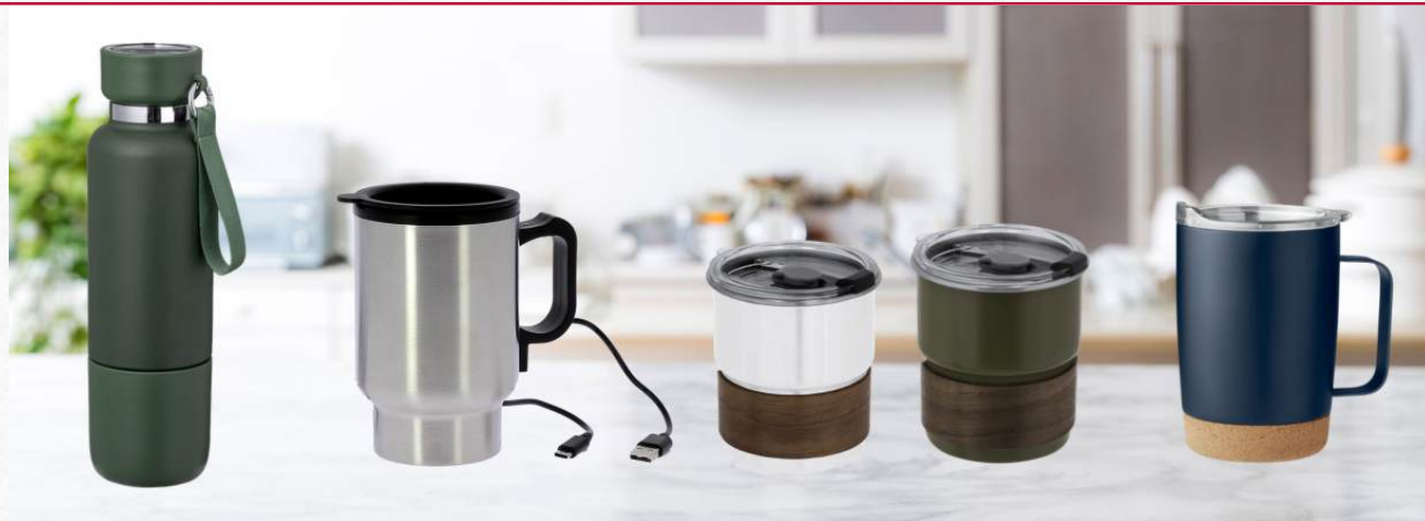
ACC8669 à ACC8670 Bidon thermique original fabriqué en acier inox de 500ml - 26 cm