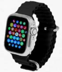
ACC7158 Montre connectée multifonction bluetooth 5.3