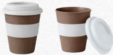
ACC8753 Mug en cosse de café + couvercle 350ml