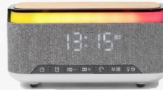
ACC8652 Enceinte sans fil multifonction avec chargeur sans fil