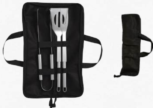
ACC5170 Ensemble de 3 ustensiles pour barbecue présentés dans une trousse avec anses.