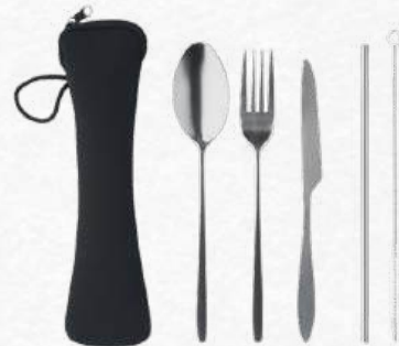
ACC5757 Ensemble de couverts réutilisables en acier inoxydable