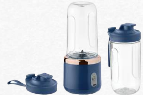
ACC8543 Mixeur à smoothie portable- 6 lames + 2 tasses