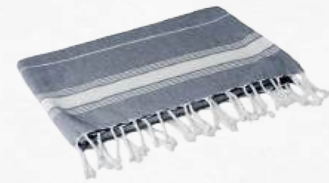
ACC5899 Foutah de plage 90 x 170 cm 180g/m 2