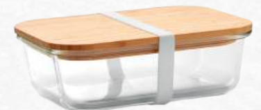
EMB5491 Lunch box en verre borosilicate et couvercle bambou 1520 ml