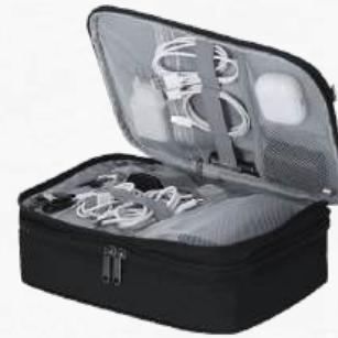
Mkt22195 Étui organisateur RPET 600D. Grand format 27 x 20.5 x 9 cm