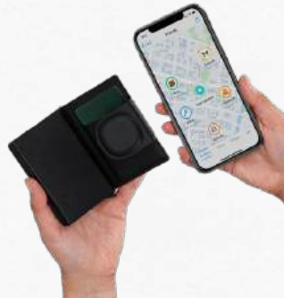
22327 Porte-Cartes Traqueur localisation PU intelligent