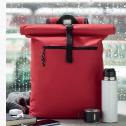
ACC8800 Sac à dos en polyester 600D avec dos rembourré et renforcement de la base.