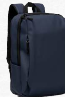
ACC8653 Sac à dos en cuir PU doux au toucher, poche pour tablette + 2 poches latérales