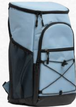
ACC8654 Sac à dos isotherme 18 litres cordon élastique sur devant et poches latérales en filet 26 x 40 x 19 cm