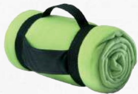
ACC5173 Couverture polaire plaid avec poignée de transport 150 x 120 cm