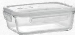
ACC7187 Lunch box en verre borosilicate avec un couvercle d'étanchéité PP 1520 ml