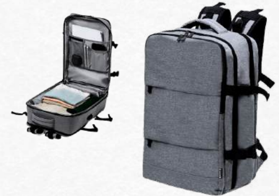
ACC7191 Sac à dos travel gris 33 x 51 x 20 cm