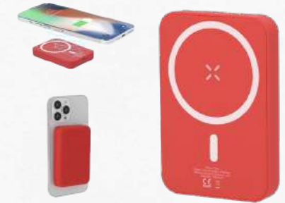
ACC8482 Batterie externe sans fil et magnétique 5000 mAh