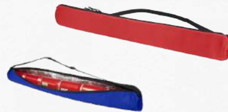
ACC8750 / ACC8751 Sac à bandoulière pour boissons 3L bleu ou rouge