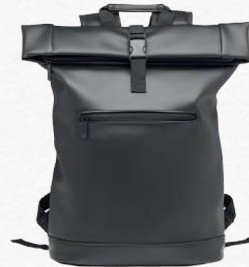
ACC7141 Sac à dos enroulable en cuir PU 29 x 13 x 54 cm