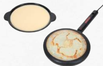
ACC8540 Crêpière électrique