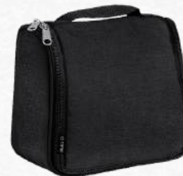
ACC7186 Trousse de toilette 600D RPET 20 x 16 x 7 cm