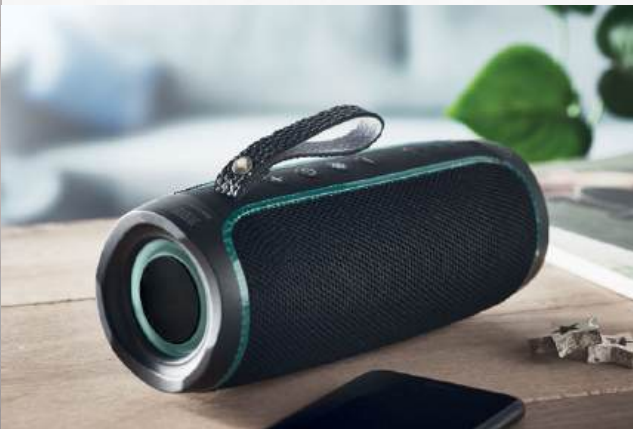
ACC6630 Haut-parleur sans fil LED 2x5W IPX4 résistant aux éclaboussures et lumière LED changeante avec batterie 1800 mAh