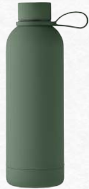
ACC8801 Bouteille isolante sous vide à double paroi en acier inoxydable recyclé avec finition caoutchouc et poignée silicone 500 ml.