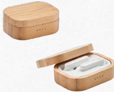
ACC6616 Jeu de 2 écouteurs stéréo sans fil (TWS) 5.0 dans un étui en bambou avec microphone et batterie 30mAh intégrée