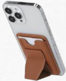
22463 Porte-carte élégant, avec un support multifonctionnel qui permet différentes positions.