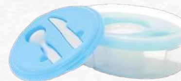
EMB5108 Lunch box bleu en PP + rafraichisseur pain de glace + couverts