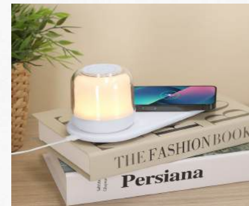
21357 Lampe multifonctionnelle 2 en 1 : Lampe de table portable sans fil avec chargeur et 12 LED et Chargeur sans fil 15W