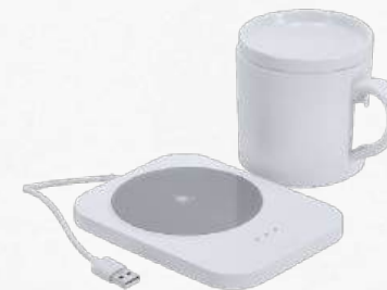
ACC8474 Chauffe-gobelet avec chargeur sans fil intégré de 15W