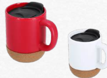
Mkt22290 Tasse thermique capacité 330 ml en céramique 10.8 cm