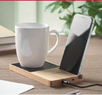
MO2154 Chargeur sans fil en bambou comprenant un chauffe-tasse et un support pour téléphone 15W