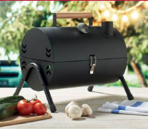
ACC7957 Barbecue portable avec cheminée