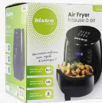
ACC8775 Friteuse sans huile 4.5 L 1400 W