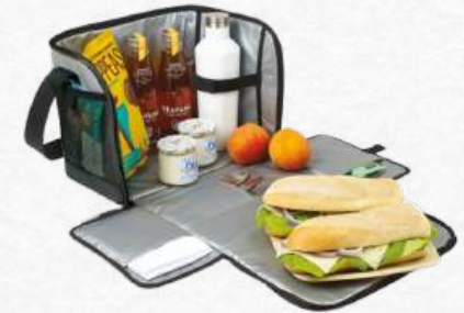
EMB5490 Lunch bag dépliant noir isotherme 40 x 22 x H28 cm