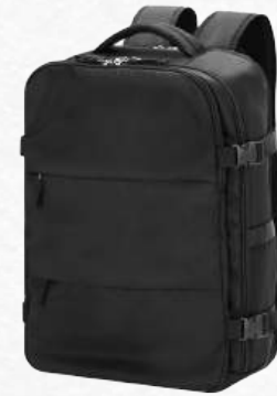
22440 Sac à dos à vide en nylon souple + pompe à vide de 35W - 30 x 45 x 20 cm