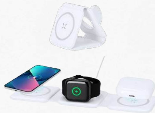
21355 Chargeur sans fil magnétique complet 15W conçu pour la charge simultanée de smartphone, écouteurs et smartwatch.