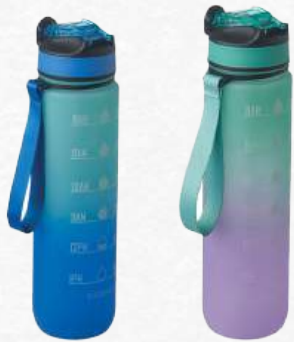
ACC7961-62 Bouteille sport RPET & paille intégrée 1L coloris en dégradé