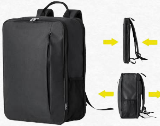
20881 Sac à dos extensible en RPET 600D 31.5 x 42 x 16 cm