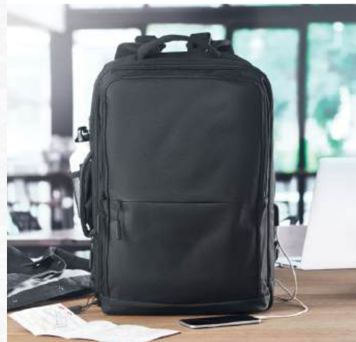
ACC7190 Sac à dos travel modulable plusieurs poches 33 x 18 x 48 cm