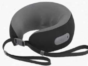
Mkt 22167 Coussin masseur portable pour les cervicales