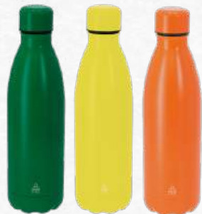
ACC8671 à ACC8684 Gourde de 790 ml acier Inoxydable recyclé finition mate 25,7cm