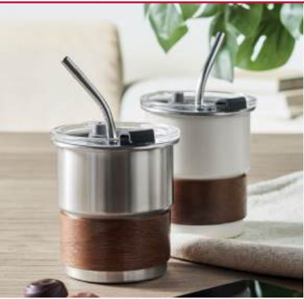
ACC7958 Mug simple paroi acier inox 260ml avec manchon en bois d'acacia