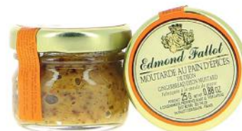
ALI2319 Moutarde au Pain d'épices 25g