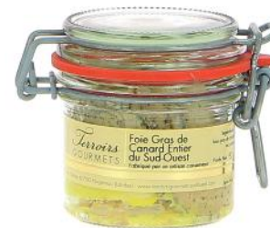
ALI6850 Verrine de Foie gras de canard entier IGP Sud Ouest 80g