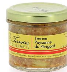
ALI6790 Terrine Paysanne du Périgord 80g