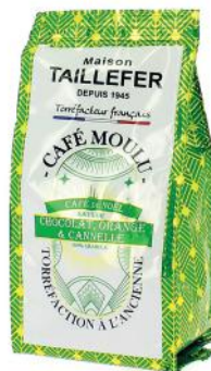
ALI6173 Café de Noël, torréfaction à l'ancienne 125g