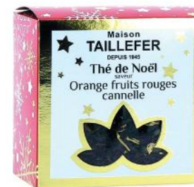
ALI6174 Thé noir de Noël saveur orange, fruits rouges & cannelle boite cube 60g