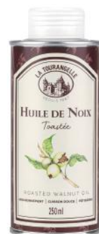
ALI6831 Huile de noix toastée La tourangelle 250ml