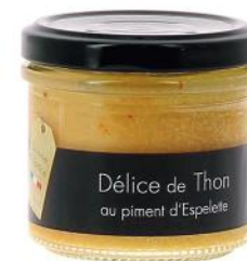
ALI4489 Délice Thon au piment Espelette 100g