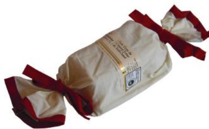
ALI6172 Ballotin de Foie Gras entier au torchon IGP Sud Ouest 120g