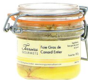
ALI257 Verrine de Foie Gras de canard entier IGP Sud Ouest 180g