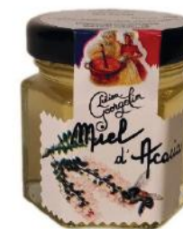
ALI4768 Verrine de miel d'acacia 47g