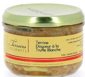
ALI6793 Terrine douceur à la truffe Blanche 180g