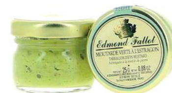
ALI2316 Moutarde Verte à l'estragon 25g