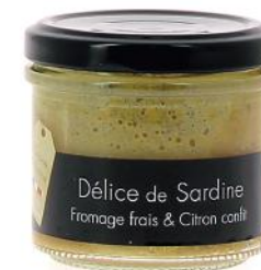
ALI4168 Verrine de Sardines au citron confit 100g