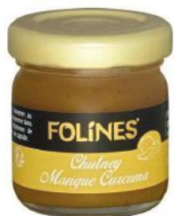
ALI5631 Chutney «Folines» mangue et curcuma 50g