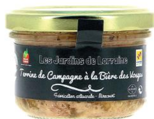
ALI3827 Terrine Lorraine de Campagne à la bière des Vosges 100g

Tarif TTC 2,50 € Gamme Terrine / verrine