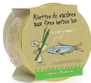
ALI6008 Rillettes de sardines aux fines herbes Bio 90g