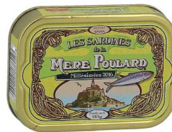
ALI6029 Sardines millésimées à l'huile d'olive de la Mère Poulard 115g