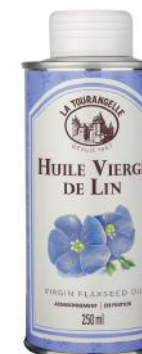
ALI6833 Huile Vierge de Lin La tourangelle 250ml