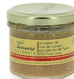
ALI6785 Sensation de Foie de Canard aux pépites de figue Verrine 80g