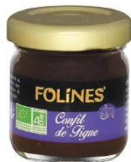
ALI5632 Confit «Folines» de figue 50g