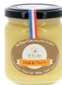
ALI407 Miel artisanal de Moselle 250g