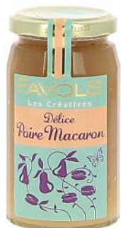
ALI5047 Confiture Poire Macaron 260g