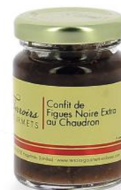
ALI6801 Confit de Figues Noire Extra au chaudron 100g