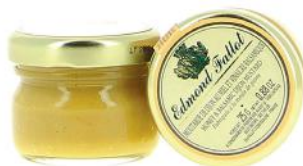
ALI4170 Moutarde au miel et vinaigre balsamique 25g