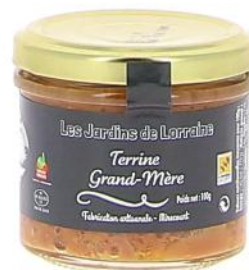
ALI4895 Terrine Lorraine de Campagne Grand-mère 100g