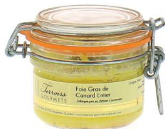
ALI4726 Verrine de Foie Gras de canard entier IGP Sud Ouest 120g