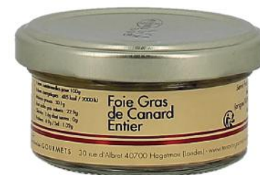
ALI6226 Verrine de Foie Gras de canard entier Origine France 50g