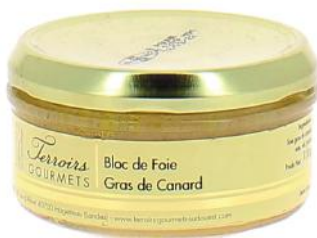
ALI6802 Bloc de foie gras de Canard verrine 110g