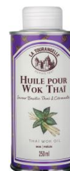
ALI6832 Huile pour Wok Thaï La tourangelle 250ml