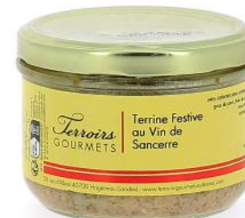
ALI6789 Terrine Festive au Vin de Sancerre 180g