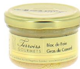
ALI2675 Bloc de foie gras de Canard verrine 80g