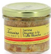
ALI6792 Terrine douceur à la truffe Blanche 80g