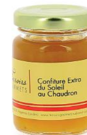
ALI6800 Confiture Extra du Soleil (Pêche, abricot, pomme) au chaudron 100g