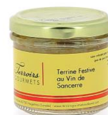
ALI6788 Terrine Festive au Vin de Sancerre 80g

Tarif TTC 2,50 € Gamme Terrine / verrine