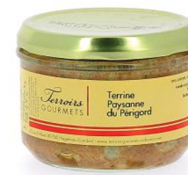
ALI6791 Terrine Paysanne du Périgord 180g