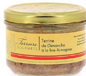
ALI5580 Terrine du dimanche à la fine Armagnac 180g