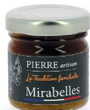
ALI6062 Confiture de Moselle artisanale à la Mirabelle 40g