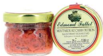
ALI2318 Moutarde au Cassis de Dijon 25g