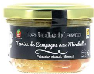
ALI3825 Terrine Lorraine de Campagne aux mirabelles 100g