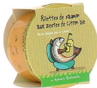
ALI6007 Rillettes de saumon aux zestes de citron Bio 90g