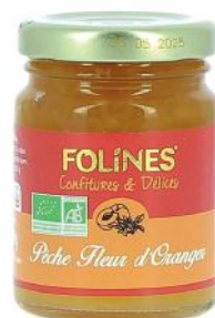
ALI6079 Délice «Folines» pêche fleur d'oranger bio 110g