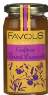
ALI5629 Confiture Favols «les créatives» Abricot lavande 260g