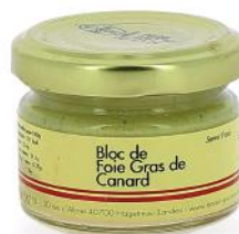
ALI4963 Bloc de foie gras de Canard verrine 50g