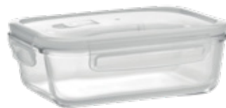
ACC7187 Lunch box en verre borosilicate avec un couvercle d'étanchéité PP

Retrouvez notre gamme complète sur notre site internet ou sur demande : www.lafabriquecadeaux.com