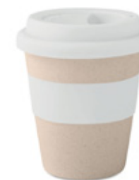
ACC5245 Mug en fibre de Bambou 350ml