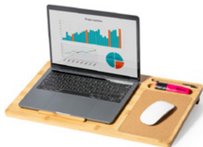
ACC7174 Tapis de souris multifonctionnel en bambou