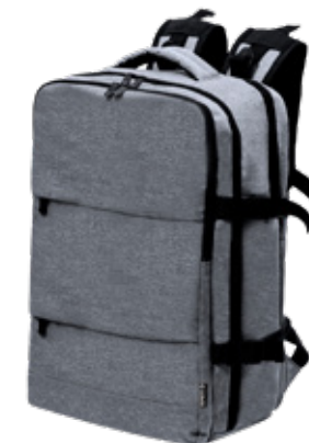
ACC7191 Sac à dos travel gris 33 x 51 x 20 cm