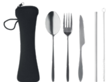
ACC5757 Ensemble de couverts réutilisables en acier inoxydable