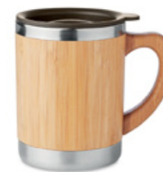
ACC5206 Gobelet double paroi bambou Mokka 300 ml