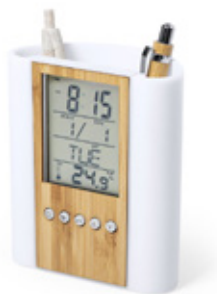
ACC6974 Porte-crayons multifonction Petrox