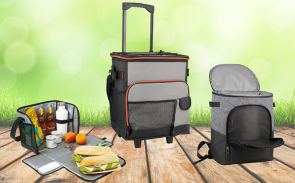
EMB5490 Lunch bag dépliant noir isotherme 40x22xH28 cm

Retrouvez tous nos objets cadeaux dans nos catalogues objets (sur demande).