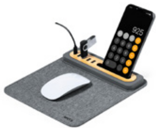
ACC7159 Tapis de souris avec port USB & support tél en RPET/bambou