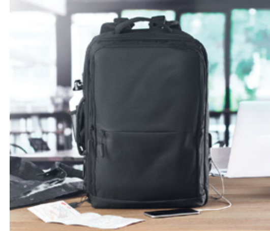
ACC7190 Sac à dos travel modulable plusieurs poches 33 x 18 x 48CM