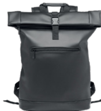
ACC7141 Sac à dos enrrollable en PU 29 x 13 x 54 cm