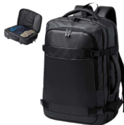
ACC7176 Sac à dos travel en PU & poches rembourrées 33 x 48 x 16 cm