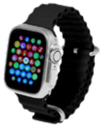
ACC7158 Montre connectée multifonction bluetooth 5.3