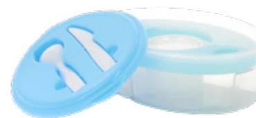
EMB5108 Lunch box bleu en PP + rafraichisseur pain de glace + couverts