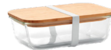
EMB5491 Lunch box en verre borosilicate et couvercle bambou 1520ml FAC02